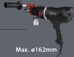
Max. \varnothing 162mm