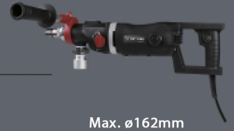
Max. \varnothing 162mm